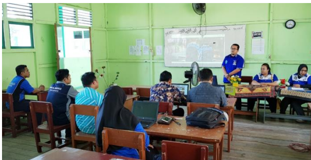
Gambar 1. Pada saat sambutan.

Kemudian dilanjutkan dengan pemaparan tentang website sekolah, pemaparan ini membahas tentang pentingnya atau mengapa website sekolah diperlukan. Selanjutnya dipaparkan peran serta kelebihan atau keuntungan website sekolah.