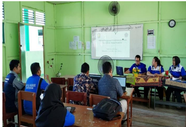
Gambar 2. Pada saat pemaparan website sekolah.

Kegiatan pelatihan ini menggunakan laptop dan LCD projector (gambar 2), penggunaan kedua alat pendukung tersebut agar para peserta dapat dengan mudah memahami materi yang diajarkan atau dijelaskan.