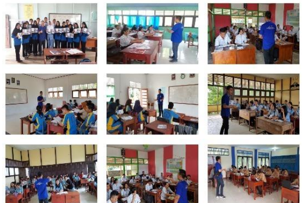
Gambar 6. Gallery sekolah.

Foto-foto pada galeri website sekolah dibagi menurut kategori dari kegiatan yang dilakukan. Dengan adanya foto-foto pada galeri sekolah maka semua kegiatan yang dilakukan SMK Al-Madani Pontianak dapat dilihat oleh guru, siswa siswi dan masyarakat umum. Foto-foto pada galeri sekolah juga akan memberikan nilai tambah bagi website sekolah SMK Al-Madani Pontianak.