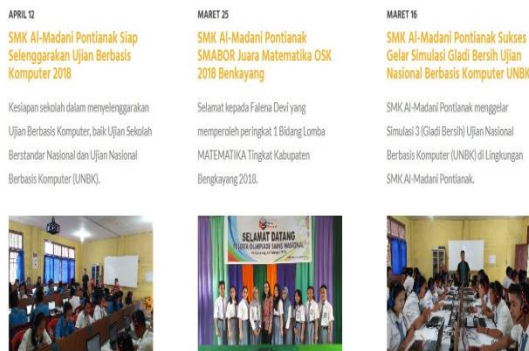
Gambar 4. Berita Utama

Menu berita utama juga akan menampilkan berita prestasi-prestasi yang dicapai oleh siswa atau oleh SMK Al-Madani Pontianak. Menu ini secara tidak langsung akan memberitahukan kepada masyarakat umum tentang prestasi yang dicapai oleh siswa atau oleh SMK Al-Madani Pontianak.