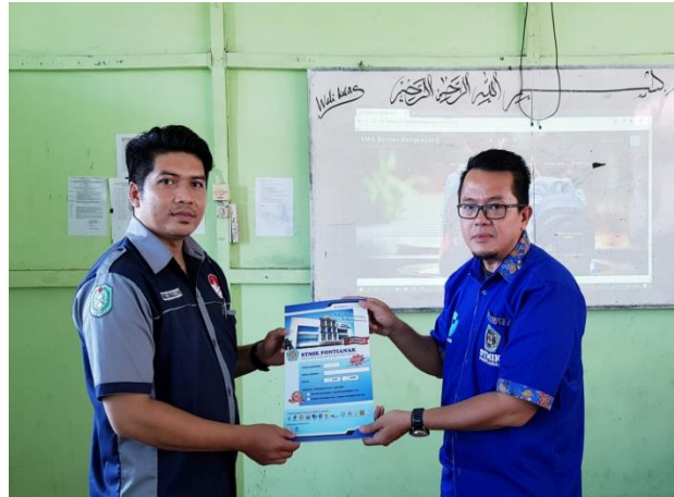
Gambar 8. Pemberian sertifikat.

Setelah pelatihan selesai, pada sesi akhir kegiatan pelatihan diberikan sertifikat bagi para guru yang menjadi peserta (Gambar 8). Pemberian sertifikat ini dilakukan sebagai bentuk penghargaan kepada guru yang telah mengikuti kegiatan pelatihan ini dan juga sebagai bukti bahwa para peserta atau para guru sudah pernah mengikuti pelatihan website sekolah khususnya SMK Al-Madani Pontianak.