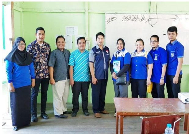
Gambar 9. Foto bersama

Setelah pemberian sertifikat untuk menutup kegiatan pelatihan ini dilakukanlah foto bersama (gambar 9).