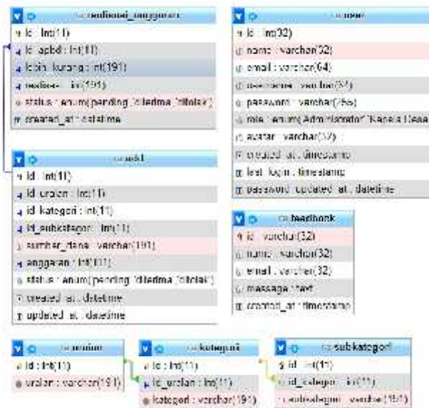
Gambar 3. Diagram Hubungan Entitas

Diagram hubungan entitas merupakan gambar hubungan antar komponen-komponen himpunan entitas dan himpunan relasi. Entitas pada website realisasi Anggaran Dana Desa pada Desa Baning dapat dilihat dari diagram hubungan entitas di bawah ini